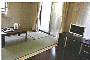
和室タイプ 202号・302号・305号室