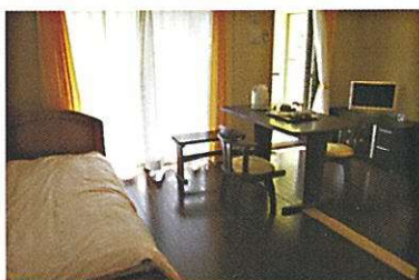
洋室タイプ 301号・303号室