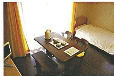
車椅子対応タイプ 203号・205号室